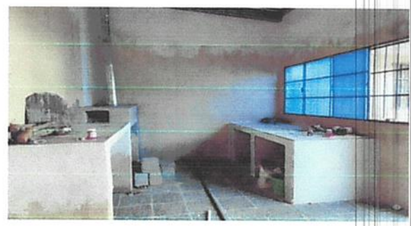
Foto 2: Culminacion del meson , Estufa Lorena y colocacion de Piso.