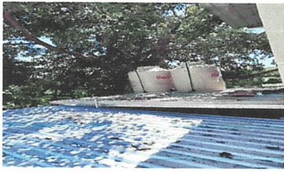
Foto1: Colocacion de losdos Rotoplast y techo.